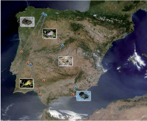
Figura 1: Localidades de estudio utilizadas en el seguimiento de la actividad acústica de cinco especies de anuros ibéricos ( Alytes obstetricans , Alytes cisternasii , Alytes dickhilleni , Hyla molleri e Hyla meridionalis ). Estas localidades se encuentran aproximadamente en los extremos térmicos (frío en azul y cálido en naranja) del área de distribución de estas especies en la Península Ibérica. Fotografías: Véase la sección de Agradecimientos.

no (2-12 semanas) y fueron más duraderos (7-112 días). Sin embargo, a pesar de que los ambientes térmicos de las poblaciones presentan notables diferencias entre sí, las especies mantuvieron patrones circadianos de actividad acústica muy similares. Como muestra la Figura 2, tras más de 1.500 días de seguimiento, no se encontraron diferencias geográficas en las horas de actividad de las especies de estudio. La hora de inicio de la actividad (1-2 horas antes de la puesta del sol) permaneció muy estable a lo largo del período reproductivo, mientras que, por el contrario, la duración de los coros fue muy variable (1-16 horas / noche). Estos patrones de actividad sugieren que las especies estuvieron expuestas a amplias fluctuaciones de temperatura durante su período reproductivo, lo que implicaría la presencia de otros mecanismos de adaptación térmica.